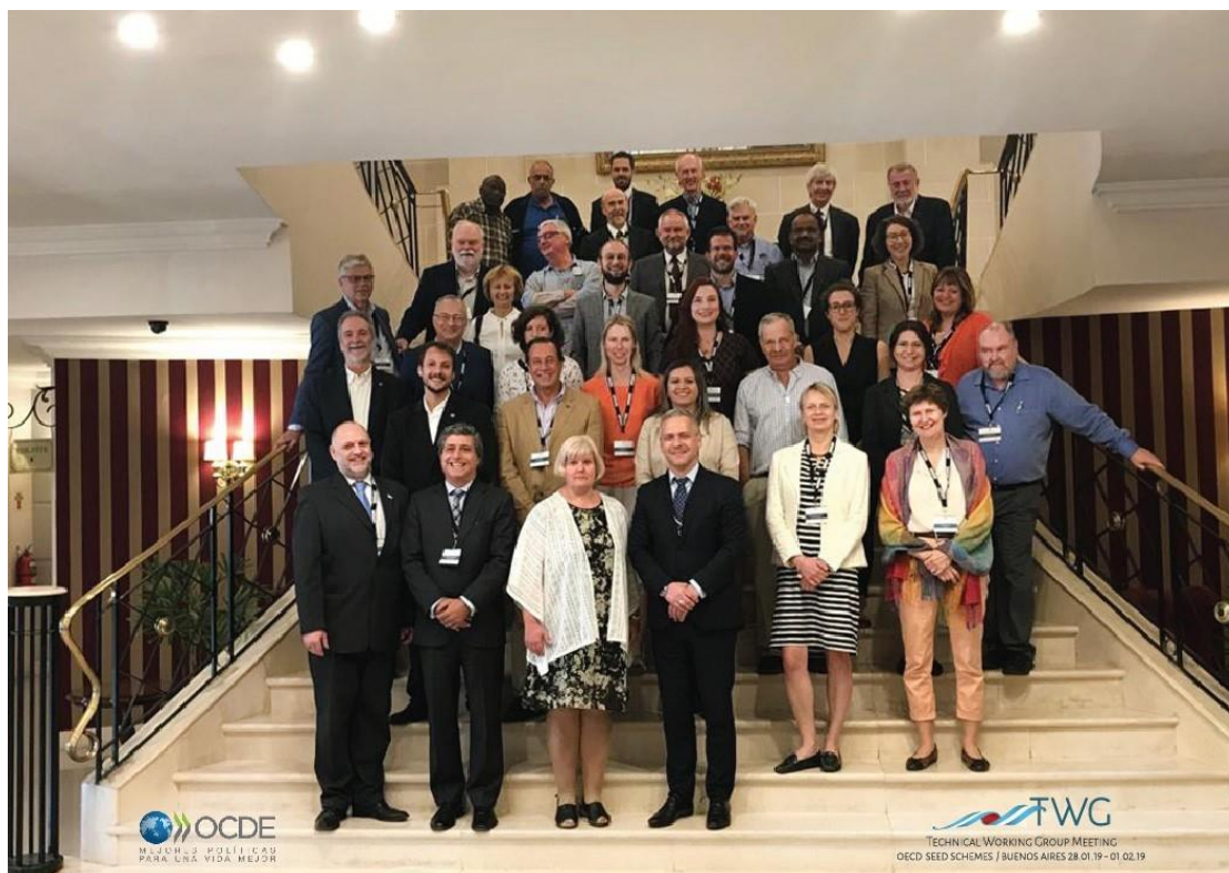
קבוצת עבודה OECD – (TWG) – ארגנטינה / בואנוס איירס - ינואר 2019